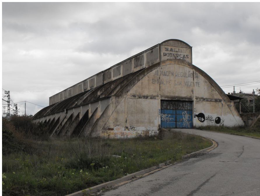
Almacén de transferencia de potasa en Sant vicenç de Castellet (Barcelona)